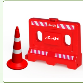
Road Safety Products