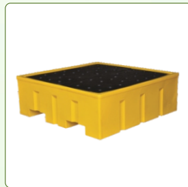
Drum Spill Containment Pallets