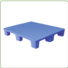
Hygienic Plastic Pallets