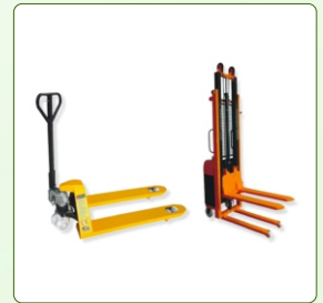
Material Handling Equipment