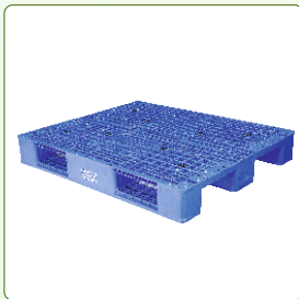
Injection Molded Plastic Pallets